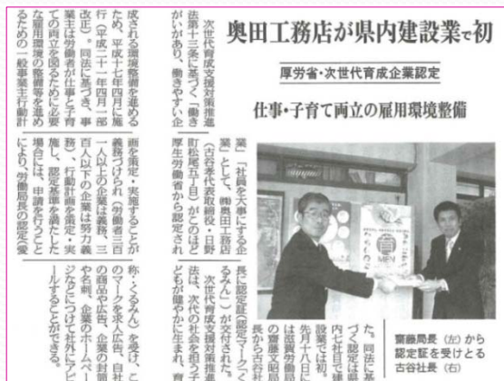
滋賀産業新聞 (2010年11月2日発行)